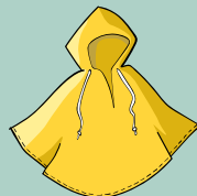
UNE TENUE ADAPTÉE À LA MÉTÉO