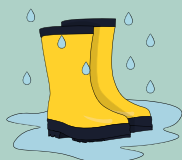
DES CHAUSSURES FERMÉES